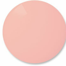
Spicy Red: Snow applications for low light conditions – cuts some blue light, improves contrast on the slopes.