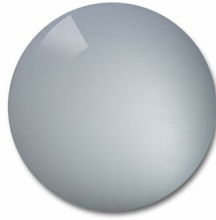
DuraVision Mirror Silver