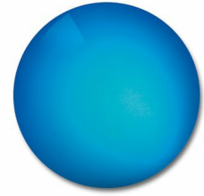
DuraVision Mirror Strong Blue