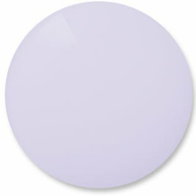
Sweet Violet: Cycling – enhances image definition and enables the eye to spot potential dangers on the asphalt.