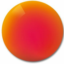
DuraVision Mirror Red

Ofrecemos lentes con una absorción lumínica de más del 90 % para condiciones de luz extremas, p. ej. en glaciares, para proporcionar una protección óptima.