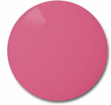
Sunset Violet: Shooting – enables clear vision and dramatic contrast between the greenish background colors and the brown color of the moving target.