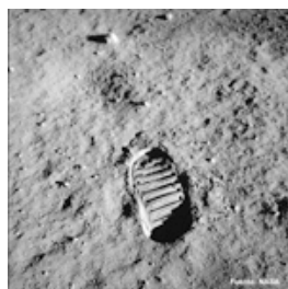
(*) Archivo. 5877_AS11_USRA

El 20 de julio de 1969, un sueño colectivo se hizo realidad. Una huella simboliza este logro. Aquel día, el hombre pisó la Luna por primera vez y los límites de lo que parecía imposible fueron redefinidos.