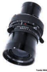
(*) ZEISS Biogon 60

El 20 de julio de 1969 el hombre pisó la luna por primera vez. Más de 500 millones de personas en todo el mundo vieron este primer paso y se asombraron con las imágenes que trajeron a La Tierra desde la superficie lunar. ZEISS diseñó el objetivo gran angular Biogon 5.6 / 60 específicamente para el aterrizaje lunar. Las fotografías debían capturar la superficie de la luna con un excelente contraste de borde a borde y una definición máxima. La cámara estaba equipada con una placa de cristal Reseau, que creaba marcas de cruz en las imágenes durante la exposición. Estas marcas distintivas hicieron posible calibrar distancias y alturas permitiendo análisis de relación de tamaño de objetos en la luna.