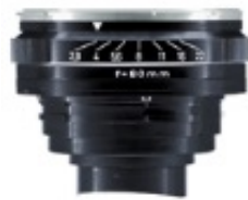
(*) ZEISS Planar 80

Las primeras fotografías del espacio se tomaron en 1962, durante la misión del Mercury Atlas 8. Entonces una imagen de La Tierra tomada desde el espacio, aún era auténtica primicia. Una cámara de formato medio con un objetivo ZEISS Planar 2.8 / 80 con solo unas pocas modificaciones con respecto a la de serie se puso en órbita por primera vez para estudiar y documentar La Tierra.