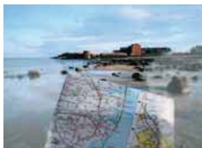
ZEISS Progresiva Plus 2